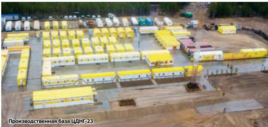
Производственная база ЦДНГ-23

На Горшковской площади Приобского месторождения внедрена и проходит опытно-промышленную эксплуатацию система телемеханики Wonderware System Platform (WSP), позволяющая удаленно контролировать скважины с возможностью дистанционного управления параметрами работы.