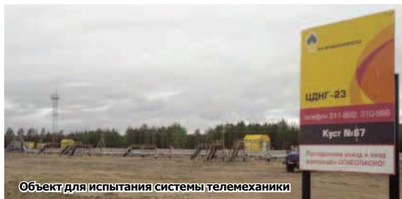
Объект для испытания системы телемеханики

Впрочем, от радиосвязи, возможно, придется отказаться в чуть более отдаленной перспективе. Есть альтернативный проект по применению оптоволоконной линии. Поначалу эта идея не выдержала критику по экономическим соображениям. Потом было предложено тянуть оптический кабель вместе с проводами линий электропередачи, при этом стоимость становится приемлемой, а нефтяники получают практически ничем не