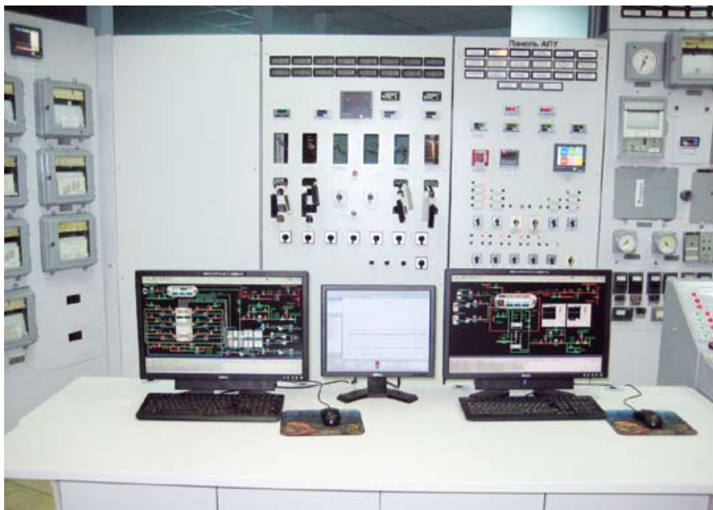
рис.6. Автоматизированные рабочие места операторов

операторские станции №1 и №2. АРМ Оператора рис. 6 обеспечивает получение информации о ходе технологического процесса, состоянии оборудования котла, диагностике оборудования полевого уровня и программно-технических средств. В качестве графического интерфейса использован программный пакет InTouch 10 компании Wonderware.