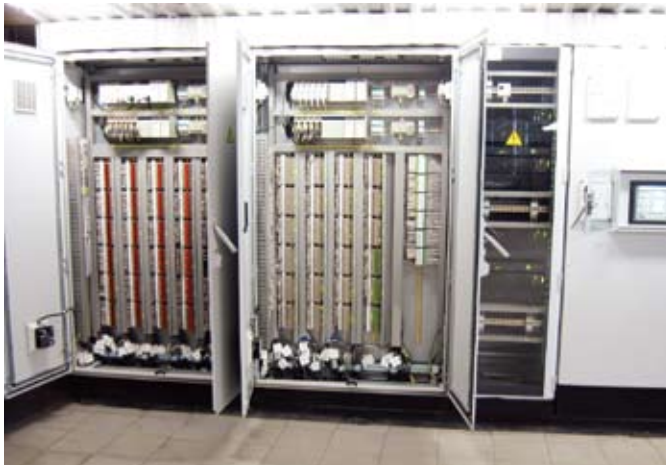
рис.4. Шкаф управления