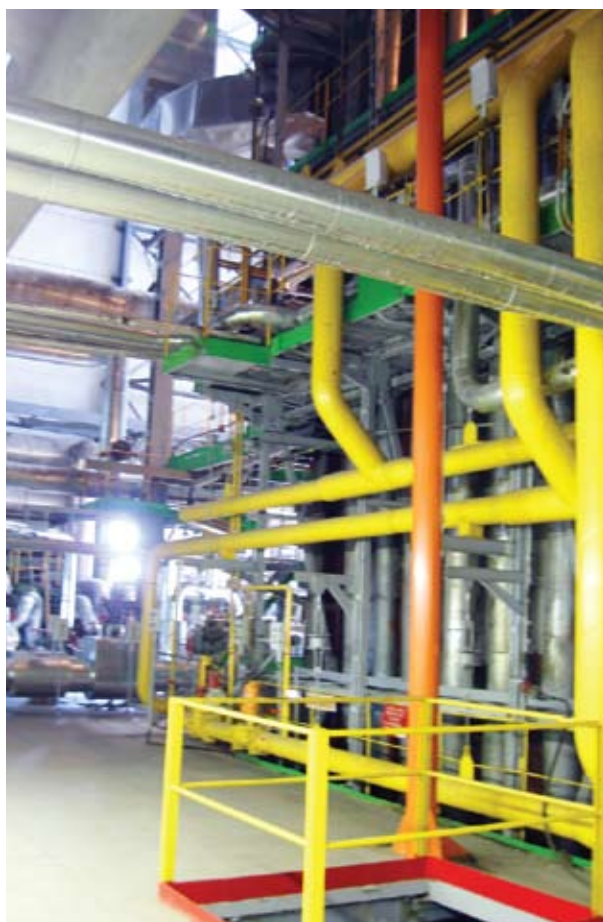
Рис 2. Котел

Котел БКЗ-210 ст.№1 рис 2. изготовлен Барнаульским котельным заводом и рассчитан на следующие параметры: