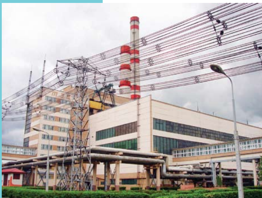
Рис 1. Бобруйская ТЭЦ-2

АСУ ТП реализована на базе программного обеспечения компании Wonderware, программируемых логических контроллеров фирмы OMRON и предназначена для автоматизации управления