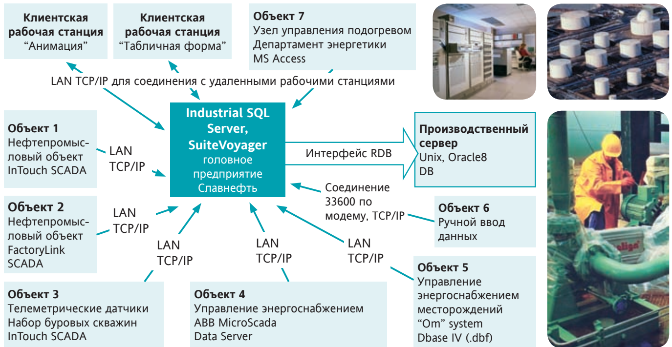
Рис.1. Источники технологических данных и пользователи.

Значимость такой системы автоматизации и отчетности производства обусловлена наличием следующих объективных факторов: