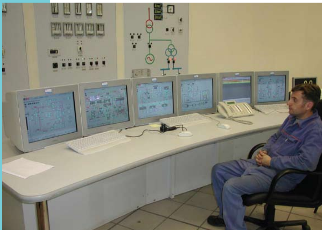
АРМ машиниста энергоблока

Все работы по этому проекту были проведены ведущими технологическими и проектными организациями: «Модульные Системы Торнадо», ЗАО «СибКОТЭС», ЗАО «Инженерный центр» Новосибирскэнерго, ОАО «НовосибирскТеплоЭлектропроект».