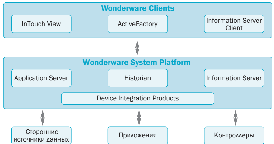
Рис. 1. Архитектура системной платформы