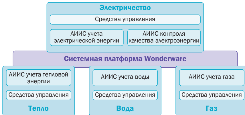
Рис. 2. Обобщенная схема комплексной системы автоматизации энергетической инфраструктуры

основе технологии ArchestrA. Он образует ядро системной платформы, и его можно назвать операционной системой для задач промышленной автоматизации. Большая часть функционала системной платформы реализована с помощью WAS.