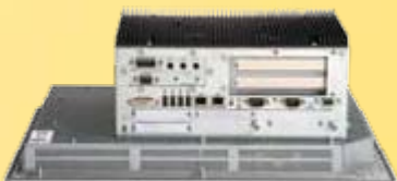
Сменный дисплей для упрощения процедуры замены

структурой, что увеличивает их гибкость и универсальность.