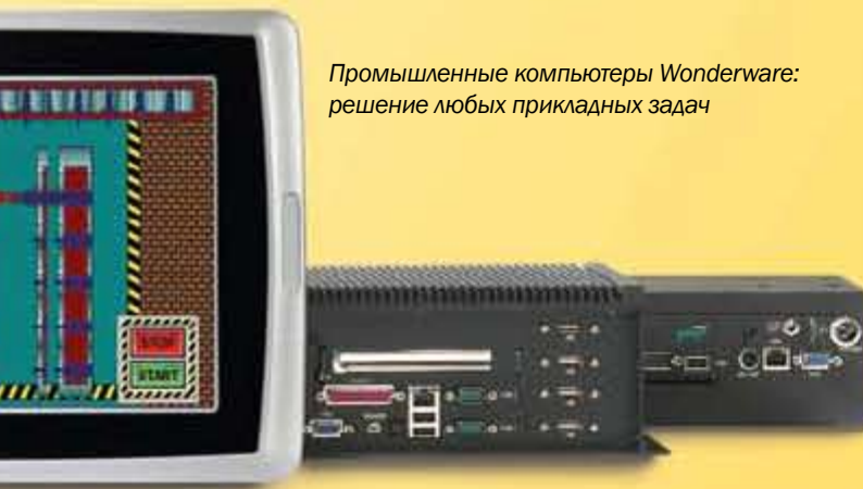
Промышленные компьютеры Wonderware: решение любых прикладных задач